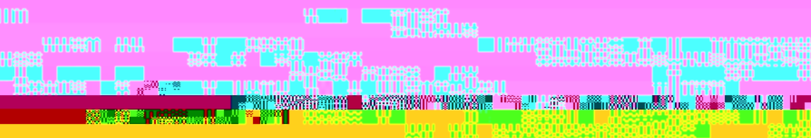
图 1 电极尖端放大 800 倍