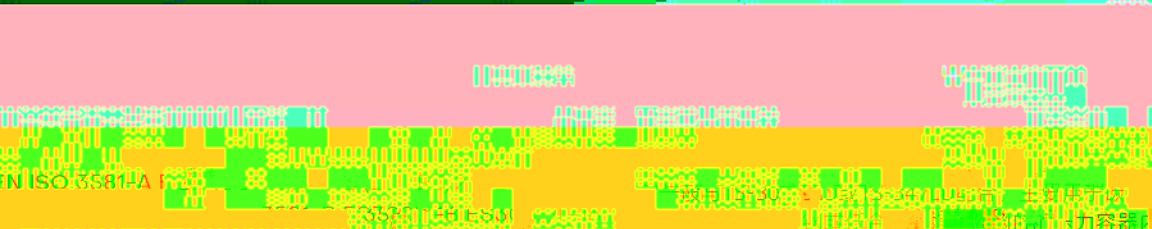
图 1 奥氏体的、铁素体钢或异种钢以及高铬钢 的高铬钢的焊接。